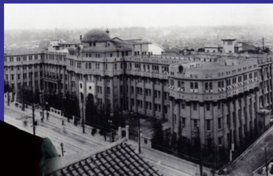
当時の明治大学記念館 明治大学史資料センター蔵