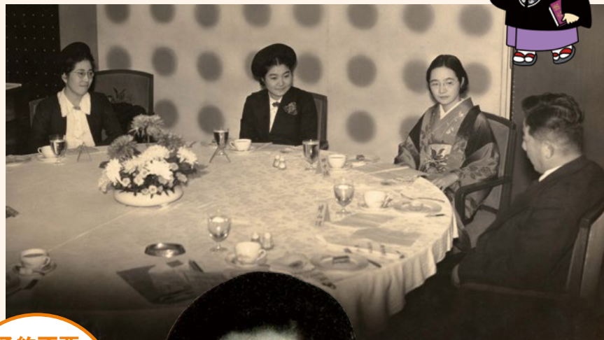
日本初の女性弁護士 左から久米愛・三淵嘉子・中田正子・ 片山哲衆議院議員との対談 (昭和14年11月20日) 個人蔵 鳥取市歴史博物館寄託