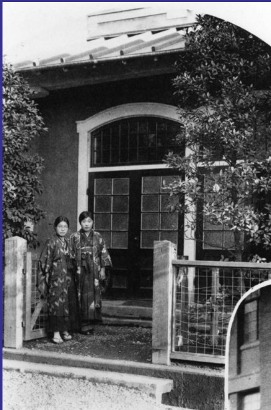
当時の明治大学女子部の校舎 明治大学史資料センター蔵